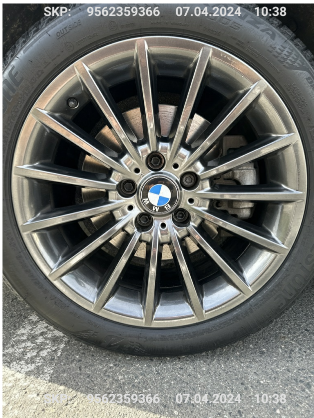
Felga przednia lewa