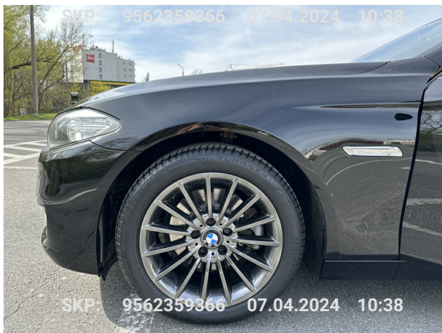
Błotnik przedni lewy