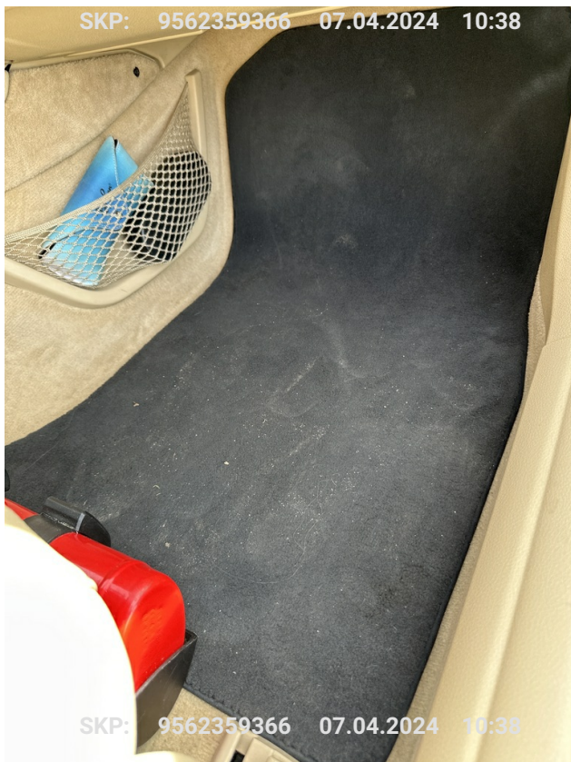
Dywanik od strony pasażera