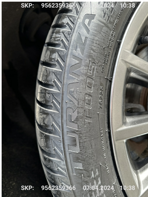
Opona tylna prawa