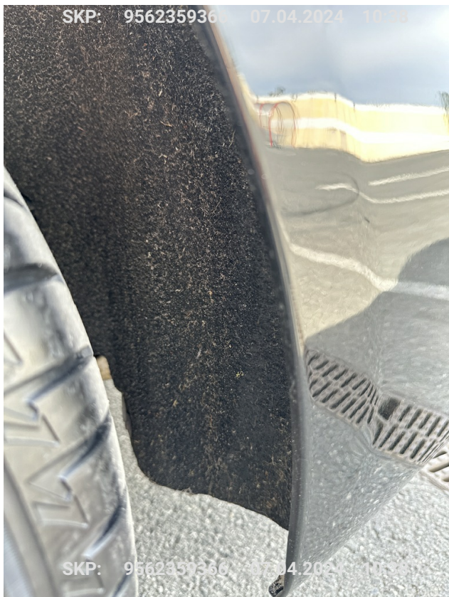
Nadkole tylne lewe