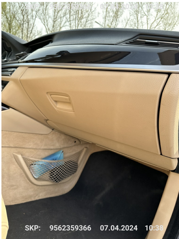
Schówek po stronie pasażera