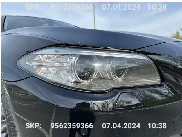
Prawy przedni reflektor