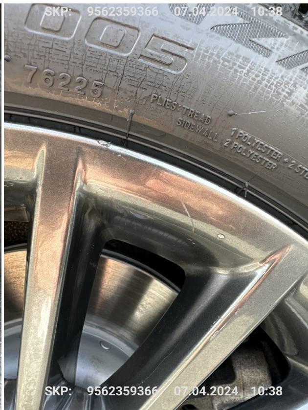
Felga przednia lewa