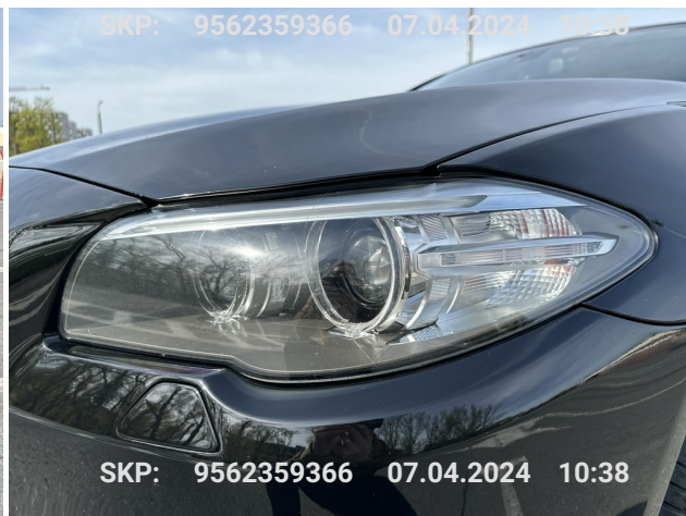
Lewy przedni reflektor