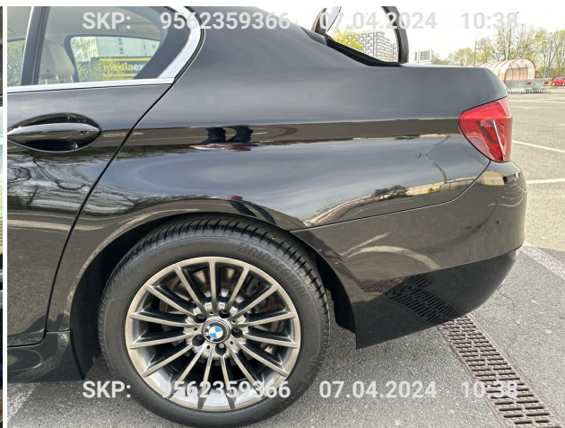
Błotnik tylny lewy