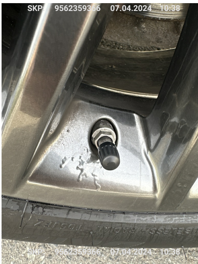
Felga tylna lewa