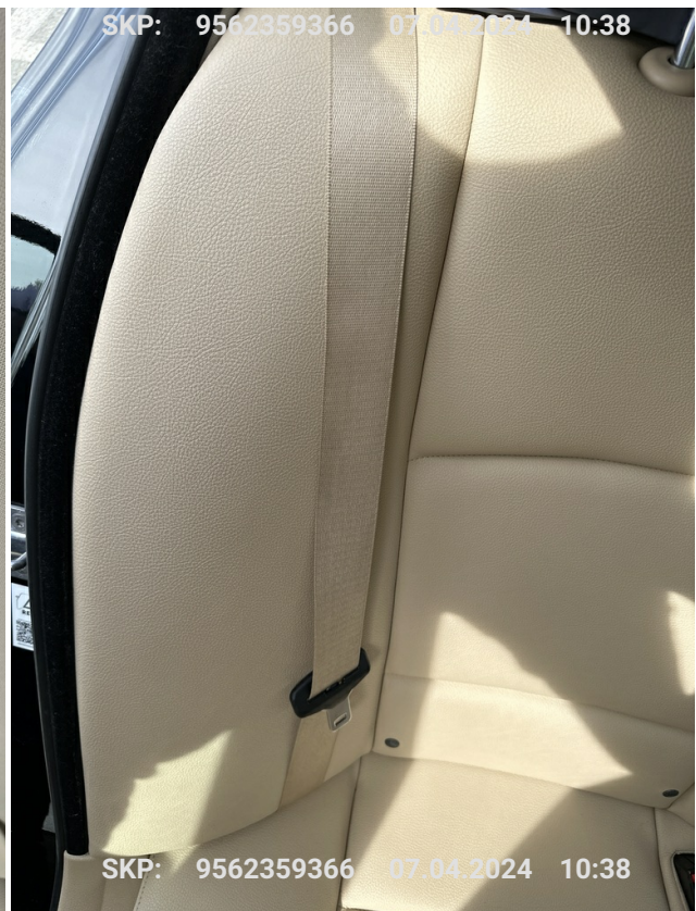
Pas bezpieczeństwa tylny prawy