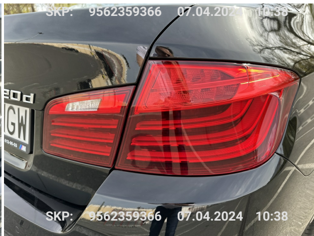
Lampa tylna prawa