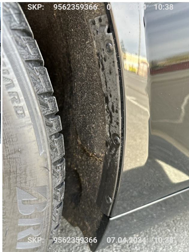
Nadkole przednie lewe