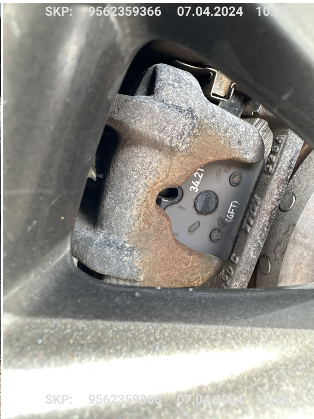
Hamulec tylny prawy