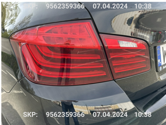
Lampa tylna lewa