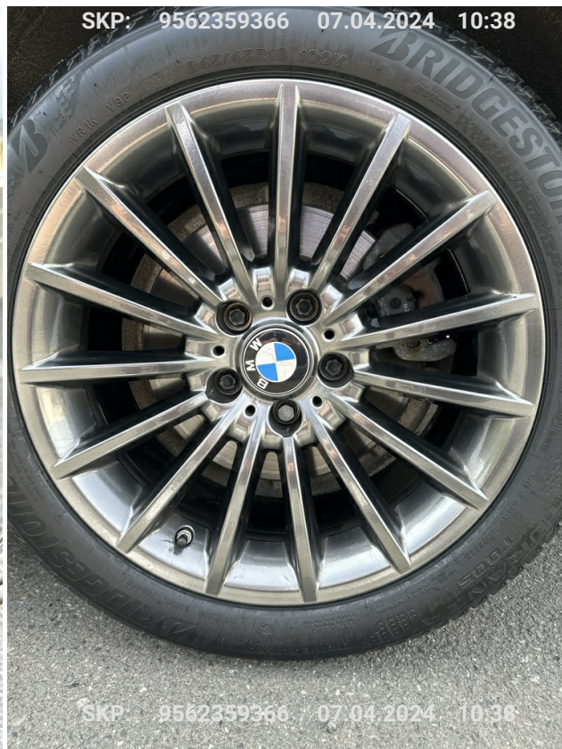
Felga tylna lewa