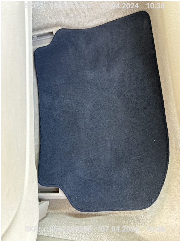
Tyłny lewy dywanik