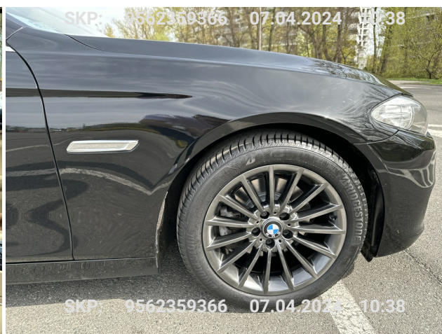
Błotnik przedni prawy