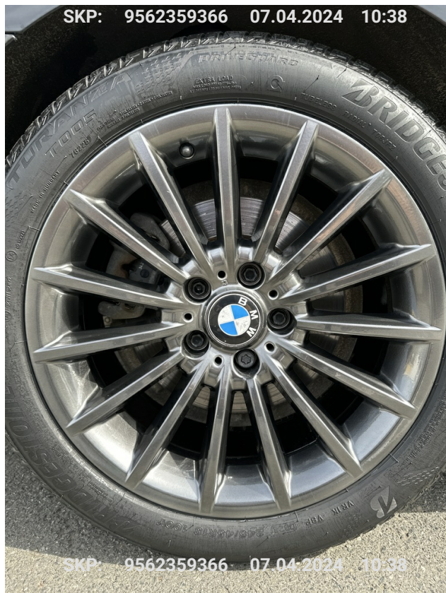
Felga tylna prawa