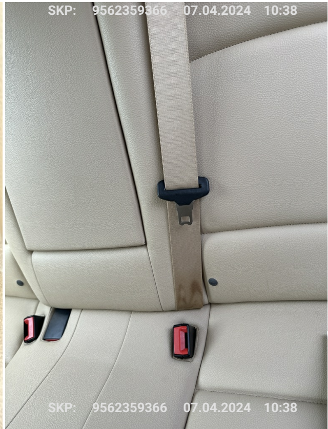
Pas bezpieczeństwa środkowy tylny