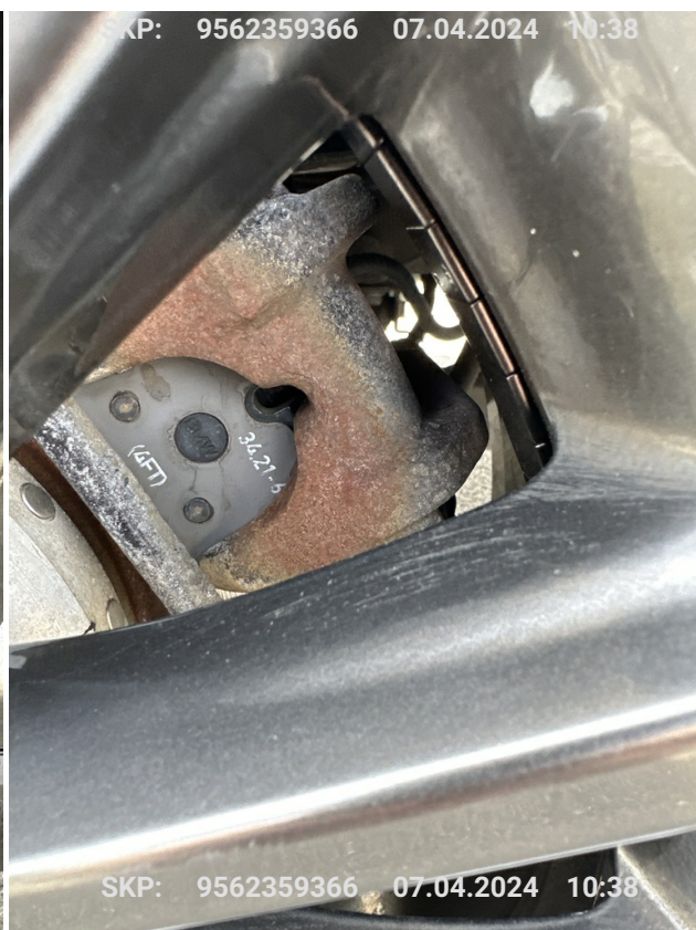
Hamulec tylny lewy